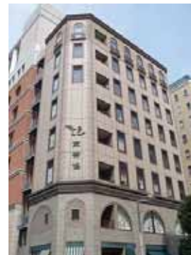
東京茶業会館 8 F 東茶協ホール 港区東新橋 2-8-5 (汐留イタリア街)

JR「浜松町」駅「新橋」駅 地下鉄大江戸線・ゆりかもめ 「汐留」駅、地下鉄三田線 「御成門」駅より 徒歩7分 地下鉄浅草線・大江戸線 「大門」駅より 徒歩8分