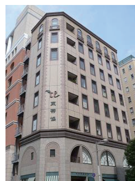
東京茶業会館 6F 会議室 港区東新橋 2-8-5

JR「浜松町」駅「新橋」駅 地下鉄大江戸線・ゆりかもめ 「汐留」駅、地下鉄三田線 「御成門」駅より 徒歩7分 地下鉄浅草線・大江戸線 「大門」駅より 徒歩8分