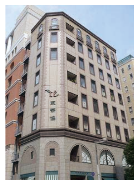
東京茶業会館 6F 会議室 港区東新橋 2-8-5

JR「浜松町」駅「新橋」駅 地下鉄大江戸線・ゆりかもめ 「汐留」駅、地下鉄三田線 「御成門」駅より 徒歩7分 地下鉄浅草線・大江戸線 「大門」駅より 徒歩8分